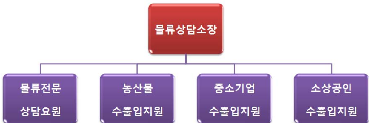
<그림 2> 수출입 물류상담소 운영방안