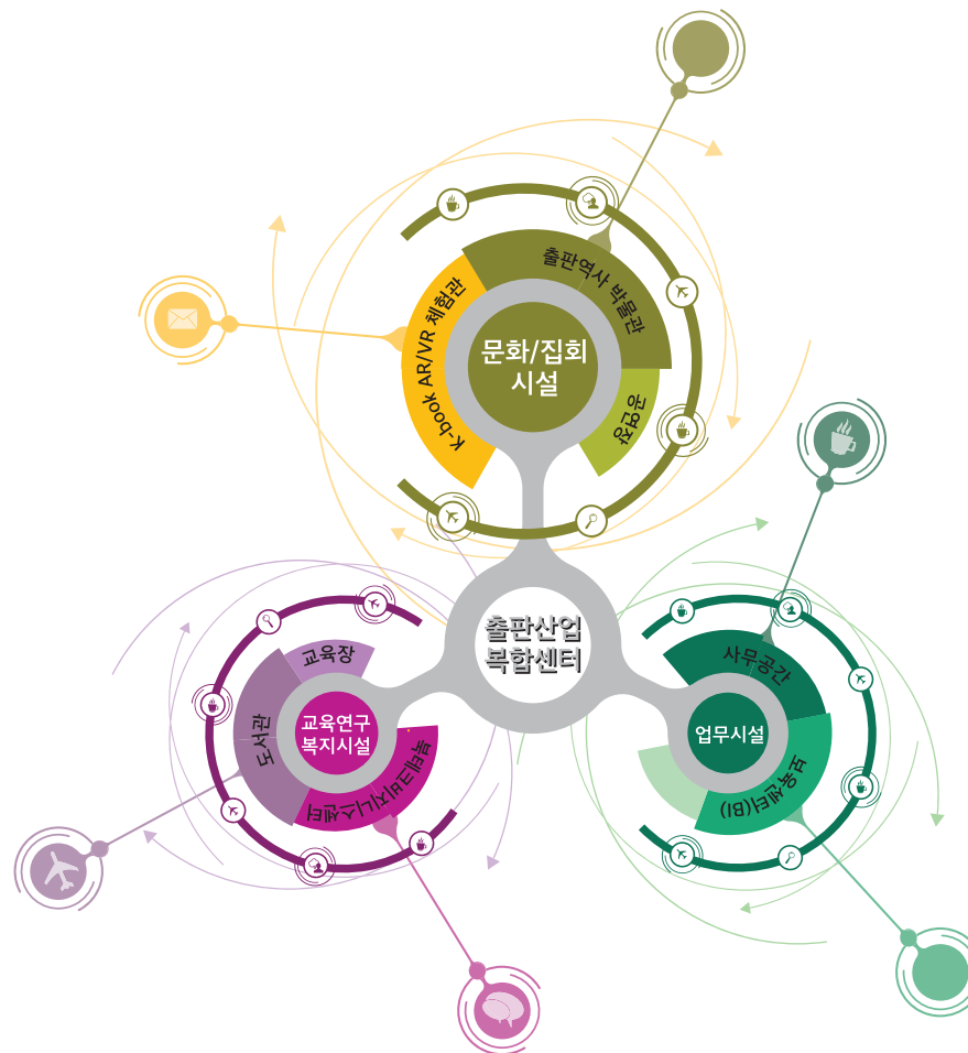
〈그림〉 전북 출판 산업 복합클러스터 구상(안)